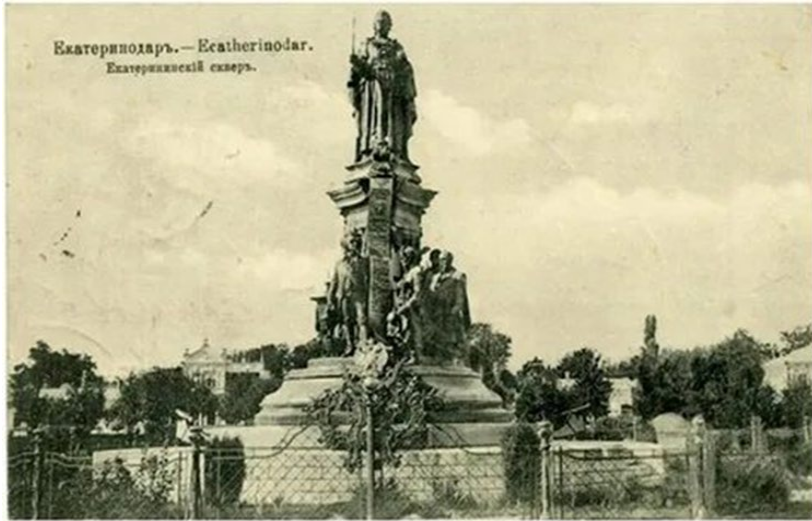
6 мая 1907 г