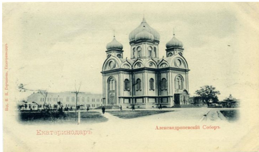
Год постройки - 1872 г .