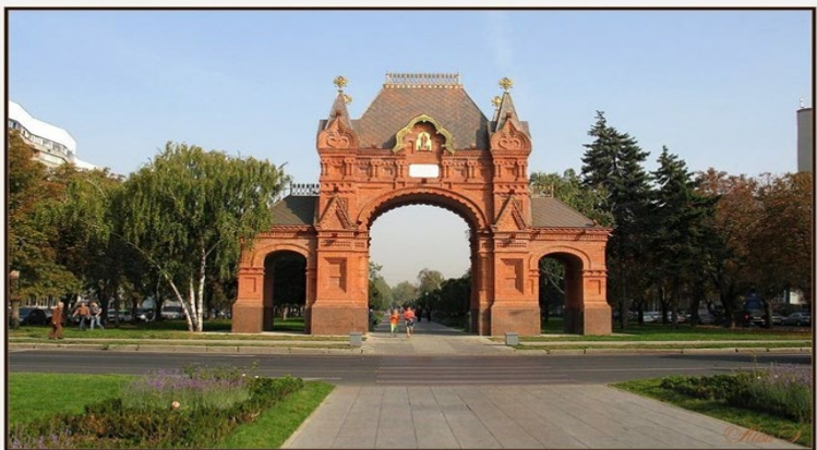
2008 г. Пересечение улиц Красной и Бабушкина

Среди самых красивых достопримечательностей Краснодара стоит отметить Александровскую Триумфальную арку, или Царские ворота.