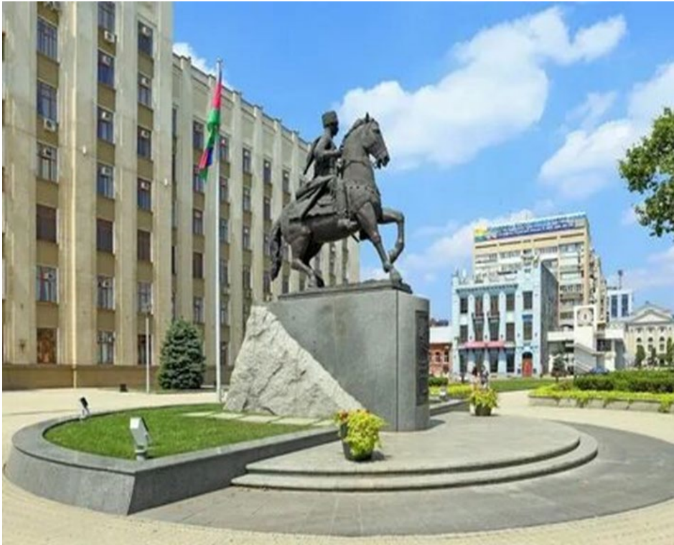
ул. Красная, 35. Здание администрации Краснодарского края

Екатеринодар был основан казаками в 1792 году и долгое время был оплотом Кубанского казачьего войска.