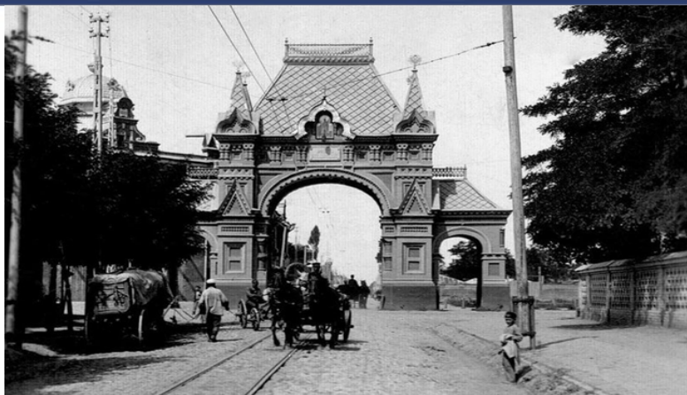
1888 г. Пересечение улиц Мира и Седина