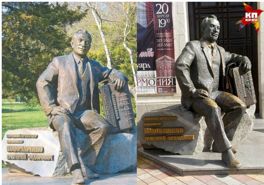
На фото слева монумент установлен в сквере на улице Красной около «Авроры», справа – около Филармонии.

Пономаренко Григорий Федорович – композитор, народный артист СССР, лауреат Государственной премии, премии им. Кирилла Россинского.