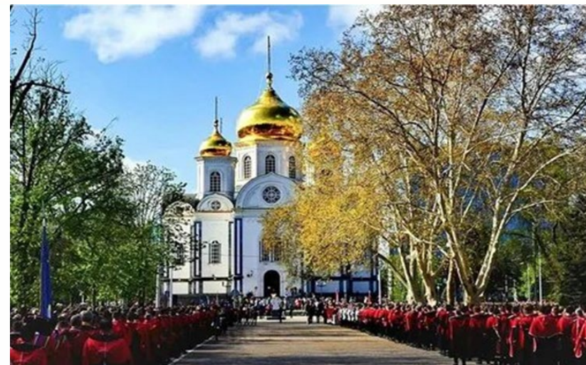
Год постройки - 2006 г

Войсковой Александро-Невский собор был заложен на войсковые средства 1 апреля 1853 года на Базарной площади Екатеринодара, на углу улиц Красной и Соборной (сейчас – улица Ленина). Осветили храм 8 ноября 1872 года.