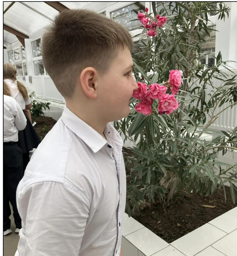
Проектная деятельность для 5-9 классов «Черенкование эониумов»