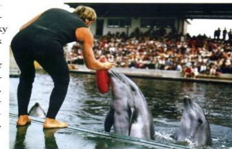
Показательные выступления в дельфинарии

Дельфиний «язык» содержит 110 звуковых выражений. Это своеобразное хрюканье, шипение, свист, жужжание, скрип и т.д. Звуки, издаваемые дельфинами, высокочастотные, и человек может их уловить лишь при замедленной скорости прослушивания звукозаписи.