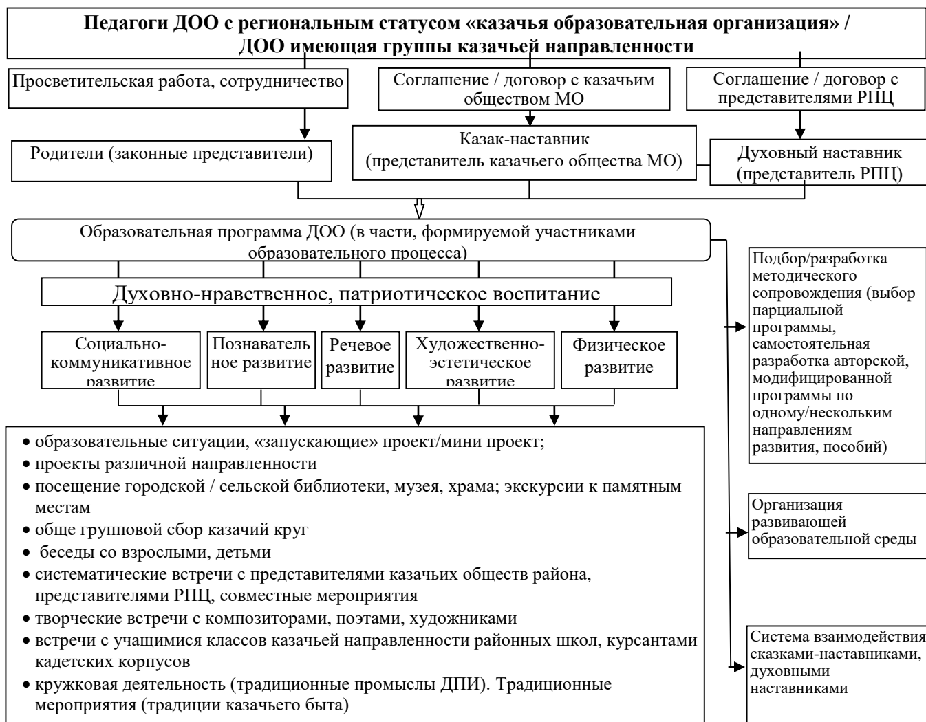
Рисунок 1. Деятельностно-содержательная модель реализации Программы

Таким образом, воспитательный потенциал культуры, традиций казачества имеет большую социальную, развивающую и образовательную роль в жизни современного ребенка, базой которого является более чем славная трехсотлетняя история казачества.