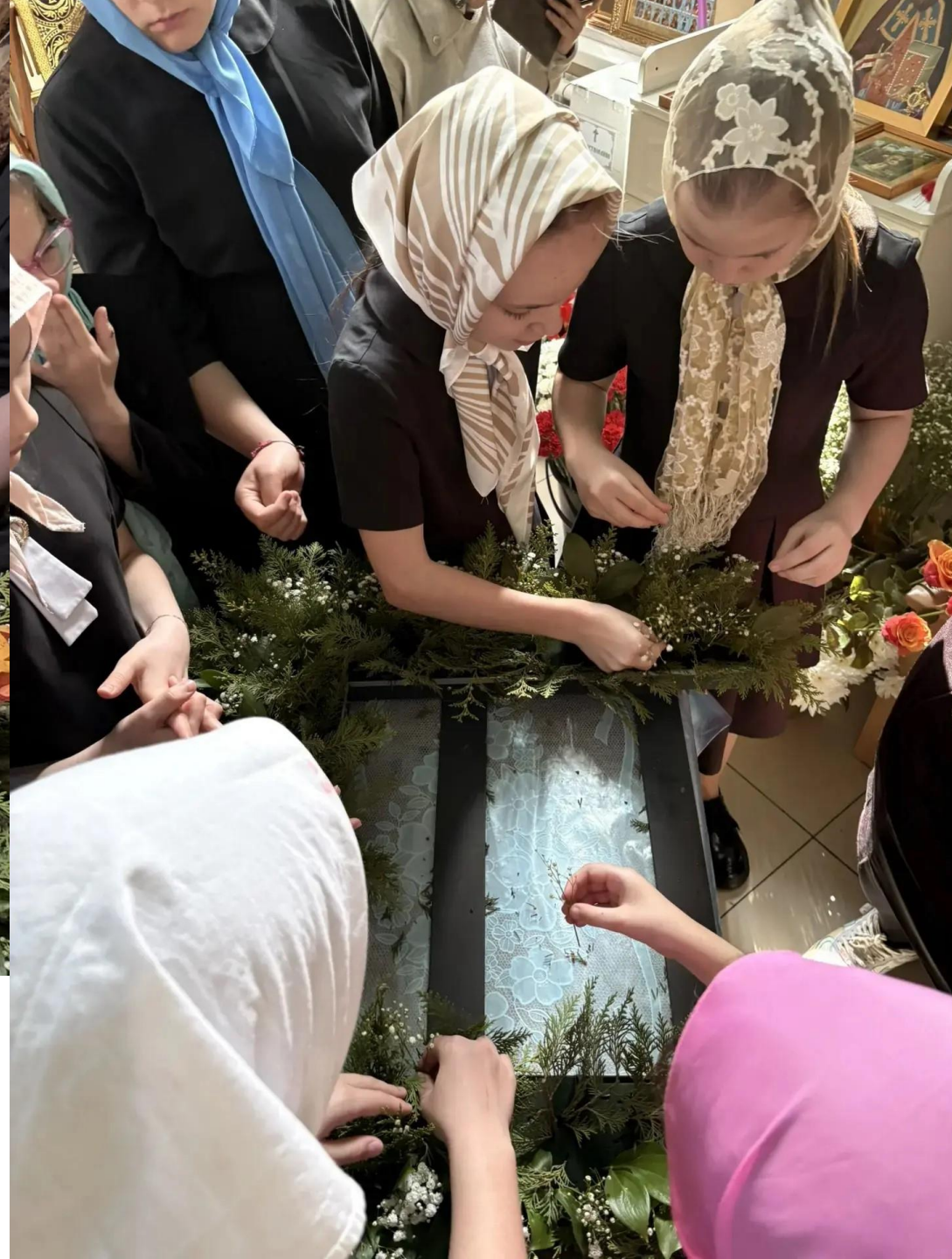
10.04. Мастер-класс по украшению храма к Светлому празднику Пасхи