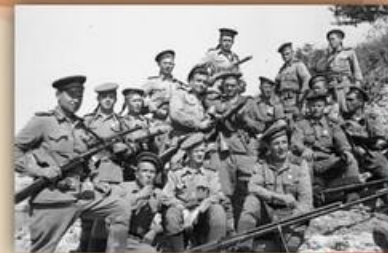
Морские десантники из отряда майора Ц. П. Куникова. В центре после высадки в ящики осталось всего троих.

штурмовые группы двух морских десантов высаживались под Новороссийском. Основной, у Южной Озерейки, успеха не имел, а второй, вспомогательный (отвлекающий), который высаживался под командованием майора Цезаря Куникова в районе Станички, был успешным. Внезапность, решительные действия 275 моряков-куниковцев, их героизм, мужество и стойкость, обеспечили успех высадки. К рассвету 4 февраля десантники заняли несколько кварталов южной части Станички и участок железнодорожного полотна протяженностью в 3 километра.