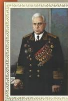
Адмирал Владимир Афанасьевич Касатонов