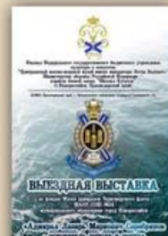
Выставка «Музей адмиралов Черноморского флота МАУВ СОШ №34 г. Новороссийск Краснодарского края»