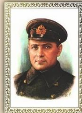
Герой Советского Союза легендарный майор Цезарь Куников

Прочно закрепившись на захваченном плацдарме, малоземельцы превратили его в нескрушимый бастион. В ходе ожесточенных боёв высаженные войска расширили плацдарм, отвлекли на себя значительные силы противника, лишили его возможности использовать Новороссийский порт.