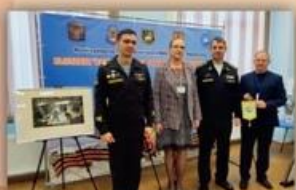
Церемония посвящённая празднику Новороссийского ВМР 8 сентября в порту Цемесской бухты в Новороссийске

Спит Цемесская бухта, в лунном свете мерцая, И усталое солнце скоро взойдет. Лишь бессонная база Военно-морская Средно мать сыновою провожает и ждёт. Сила нашего флота – твердость духа морского Это гордость любой корабельной семьи. Мы наследники славных побед Ушакова И героев-защитников Малой Земли. Не забудем вовеки дерзость флотской отваги – В мире знают Российский характер крутой. Отражается время в Андреевском флаге, Он частица истории нашей святой.