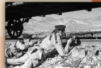
Бойцы морской пехоты Черноморского флота в бою

Успешная оборона плацдарма стала возможной благодаря массовому героизму наших бойцов и офицеров. За мужество и отвагу 21 воин Малой земли удостоен звания Героя Советского Союза. Сотни воинов армии и Черноморского флота награждены орденами и медалями.