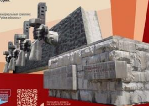
Максимальный комплекс «Губка обороны»

За город непрерывно шли бои в течение 393 дней. Новороссийск на линии фронта находился больше года. Таких примеров в истории Великой Отечественной войны больше нет. Новороссийск был самым южным участком советско-германского фронта.