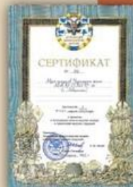
Сертификат от Музея адмиралов Черноморского флота МАУВ СОШ №34 г. Новороссийск Краснодарского края