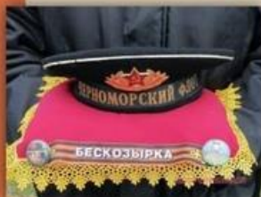
Символ памяти - морская бескозырка