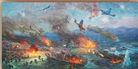
Морской десант на Малую землю Новороссийска, апрель 1943 года

служил в военно-морском флоте. В течение 16 лет службу проходил на подводных лодках, из них 8 лет командиром, имеет опыт боевых служб. Далее продолжил службу в Оперативном управлении штаба Черноморского флота, воинское звание капитан 1 ранга, награжден орденом «За службу Родине в Вооруженных Силах СССР» и многочисленными медалями.