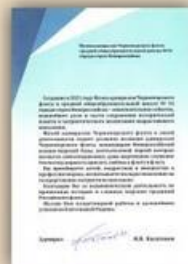
Письмо от Музея адмиралов Черноморского флота МАУВ СОШ №34 г. Новороссийск Краснодарского края