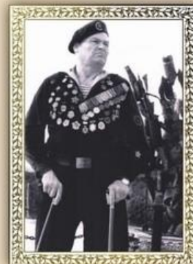
Легендарный моряк Владимир Кайда

на захваченный плацдарм, названный впоследствии Малой землей, корабли доставили 15 400 человек, большое количество артиллерии и грузов.