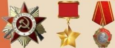
Орден Отечественной войны I степени Медаль «Золотая Звезда» Орден Ленина