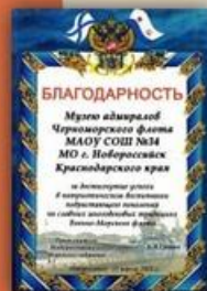
Благодарность от Музея адмиралов Черноморского флота МАУВ СОШ №34 г. Новороссийск Краснодарского края

Лазурная девизная лента с надписью: «МУЗЕЙ АДМИРАЛОВ ЧЕРНОМОРСКОГО ФЛОТА» – конкретизирует причастность гроба к музею данной школы.