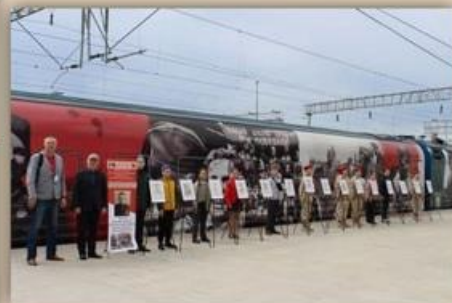
У Поезда Победы

Музей адмиралов Черноморского флота МАУВ СОШ №34 г. Новороссийска