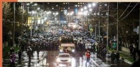
Традиция живёт: факелы получают

Акция, в которой принимает активное участие и музей адмиралов Черноморского флота МАУУ СОШ № 34 города-героя Новороссийска, проходит ежегодно, в ночь с 3 на 4 февраля, в любую погоду – и в дождь, и в морд-ост.