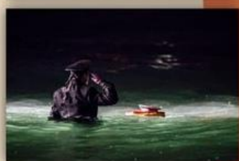
В память о подвиге моряков-черноморцев

Кровью советских воинов пропитана каждая грядь священной Малой земли.