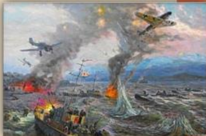
Морской десант на Малую землю Новороссийска в 1943 г.