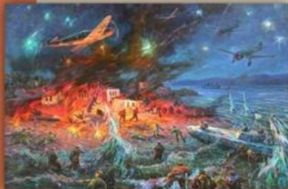
Ночной бой десанта на Малой земле Новороссийска 1943 год.

Работает в жанре станковой живописи, уделяет большое внимание морской исторической теме, занимается книжной иллюстрацией, издано более семи десятков книг и журналов с иллюстрациями и репродукциями картин. Является членом Союза художников России, Санкт-Петербургское отделение, секция живописи, также членом Творческого Союза художников России, которым в 2022 году награжден серебряной медалью «За вклад в отечественное изобразительное искусство».