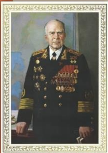
Герой Советского Союза Адмирал Флота Советского Союза Сергей Георгиевич Горшков