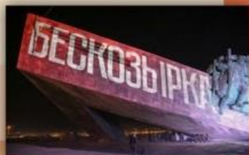
На Малой земле