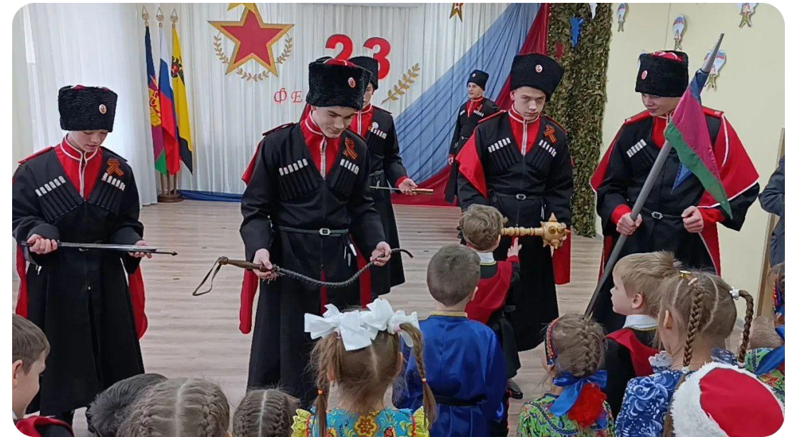
Кейс "Гость группы"